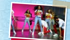
Tanzwerk Hippmann & Kinderdisco