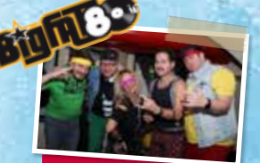
The Big Fat 80ies. Ab 19:30 am Stadtplatz