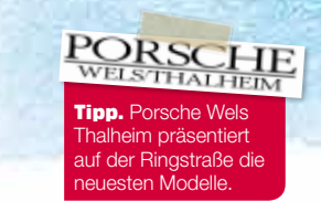
Tip: Porsche Wels Thalheim präsentiert auf der Ringstraße die neuesten Modelle.