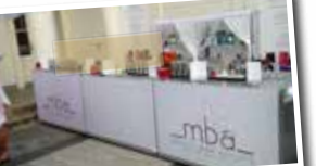
Maniac Bar Artists. Gönnen Sie sich einen Sommerdrink.