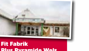
Fit Fabrik Plus Pyramide Wels.