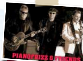
Pianofrizz Trio. Ab 18:30 Uhr in der Ringstraße.